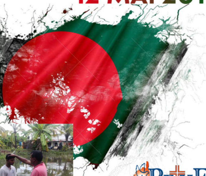
Grunge old Bangladesh flag